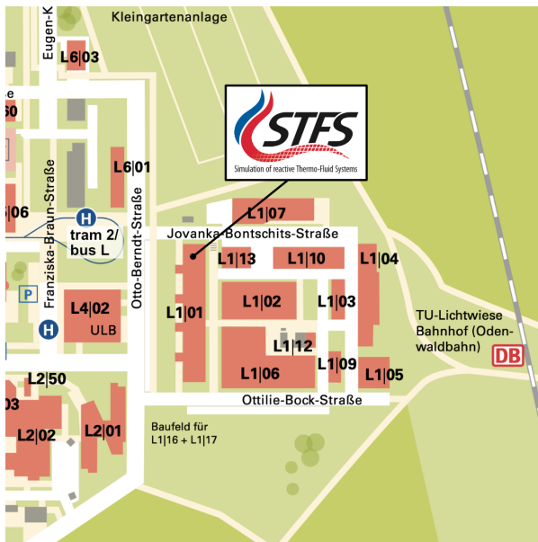
Lageplan des Standorts Lichtwiese der TU Darmstadt

Für weitere Informationen bei Ihrer Ankunft können Sie sich gerne an das Sekretariat ( Raum L1|01-283 ) wenden.